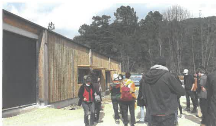
Photo ci-contre : Visite du pôle pour des étudiants de SupAgro en voyage d'étude sur le thème des circuits courts et des produits de qualité

Avec l'appui du Syndicat, les futurs utilisateurs envisagent déjà de se constituer en association afin promouvoir et commercialiser leurs produits, et d'envisager d'autres collaborations (mutualisation de matériels, élaboration de nouveaux produits ...).