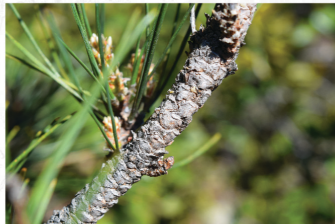
Aiguilles et rameaux

Arrivé à un âge avancé, le Salzman prend souvent un port tabulaire , c'est-à-dire en forme de table : la cime s'aplatit et forme une sorte de plateau, surtout dans les endroits aux conditions difficiles. Son tronc peut aussi être sinueux, voire tordu, et a tendance à fourcher.